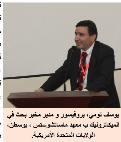
يوسف تومي، بروفيسور و مدير مخبر بحث في الميكاترونك ب معهد ماساتشوستس ، بوسطن، الولايات المتحدة الأمريكية.